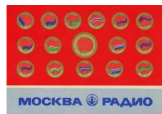
モスクワ放送局当時の QSL カード

ロシアの声放送局は、ソビエト連邦共和国時代には、モスクワ放送局として親しまれていました。当時から日本語番組は、日本国内で強力に受信でき、QSL カードもいろいろな種類のカードが用意されました。